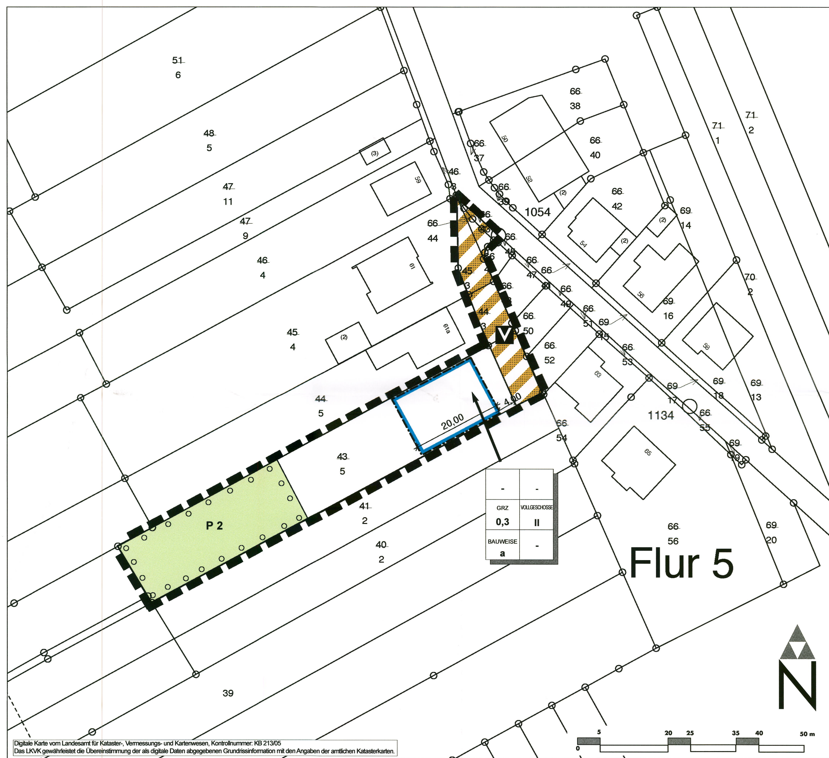
Digitale Karte vom Landesamt für Kataster, Vermessungs- und Kartenwesen, Kontextnummer: KB 21305 Das LVKw gewährleistet die Übereinstimmung der als digitale Daten abgerufenen Grundreifeinformationen mit den Angaben der amtlichen Katasterkarten.

Für alle Pflanzungen sind nur einheimische Bäume und Sträucher sowie einheimische Obstbaumhochstämme zu verwenden. Eine Auswahl geeigneter standortgerechter Gehölze stellt die im Folgenden aufgeführte Liste beispielhaft dar: